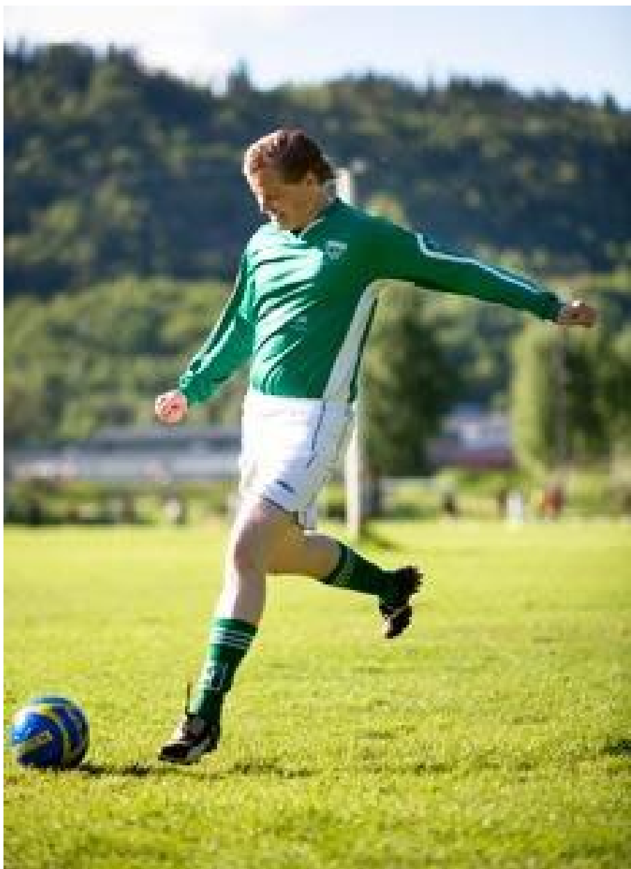
Michael Mosley och 5:2-dieten kan jag tacka för mycket!

Nämner redan nu att jag har skapat ett forum där du rätt snabbt får ett svar av mig, eller någon annan, om du undrar över något.